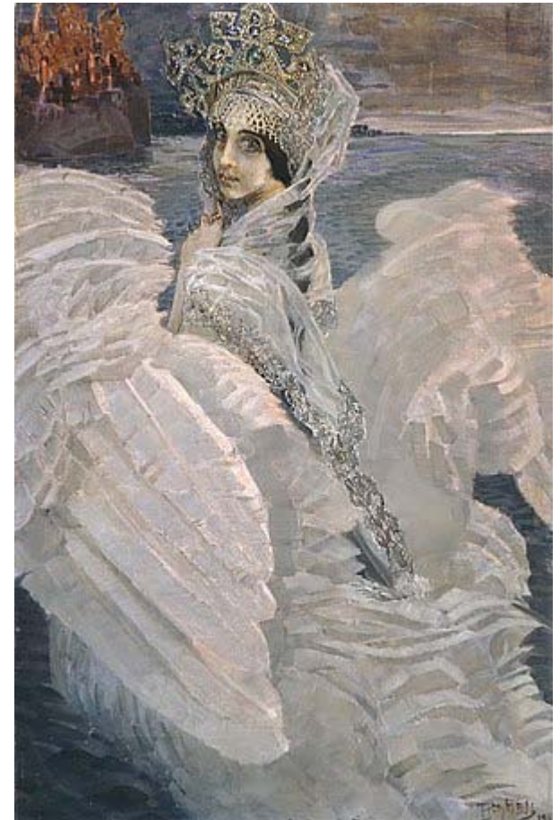
М. Врубель. Царевна-Лебедь (1900)

перенос из одного медиа в другое: роман -> опера рассказ -> балет