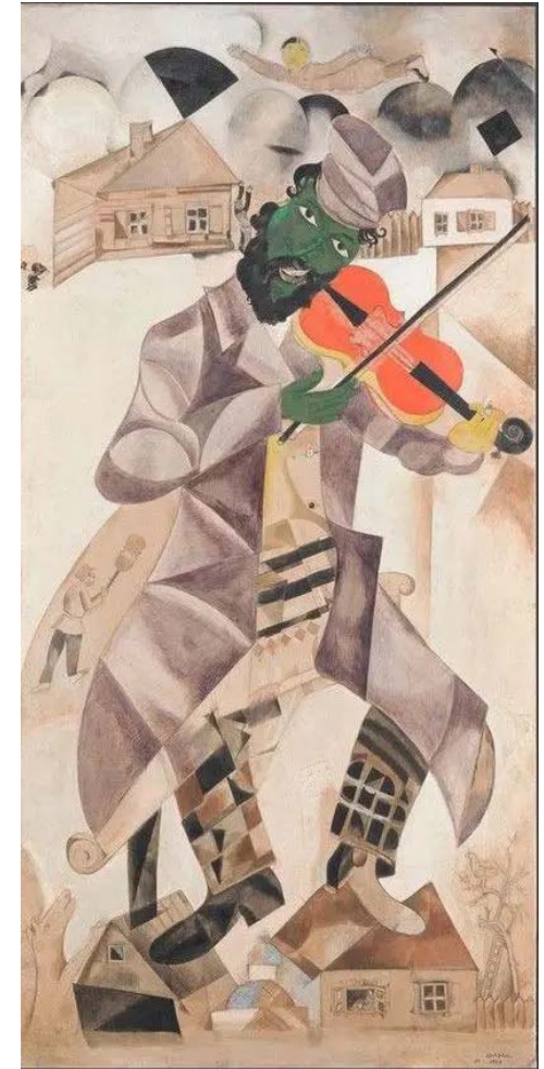
Марк Шагал. Музыкант (1920)