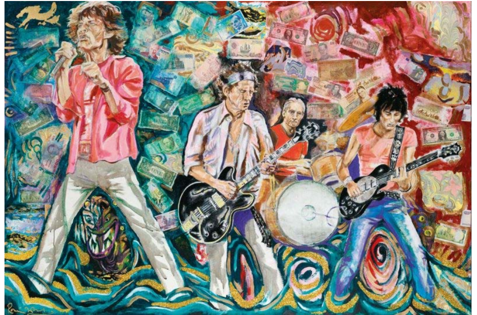
Ронни Вуд. The Rolling Stones