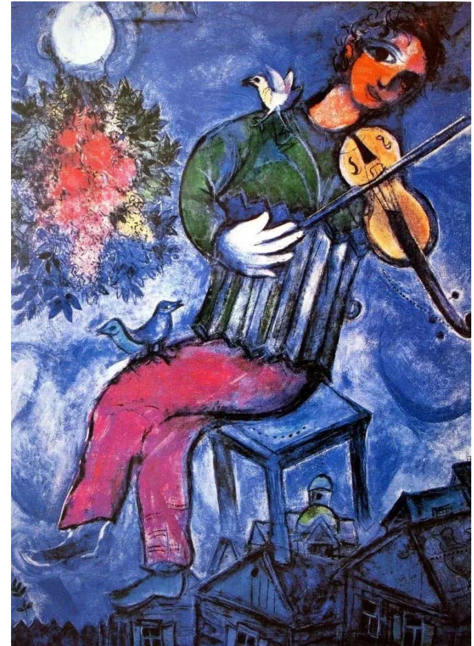
Марк Шагал. Синий скрипач (1947)