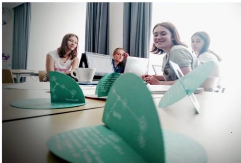
Мастерская дизайна, проект территориальной разработки «Сириус», август 2016 года

Как правило, перед переходом к производству на этапе прототипирования возникает несколько концепций. Не стоит сразу выбирать ту, которая больше всего вам нравится, пока не реализовали ее в материале. Очень часто ни у участников, ни у педагогов нет понимания, какая концепция оптимальна для реализации. Можно попробовать запрототипировать несколько вариантов и затем из них выбрать лучший.