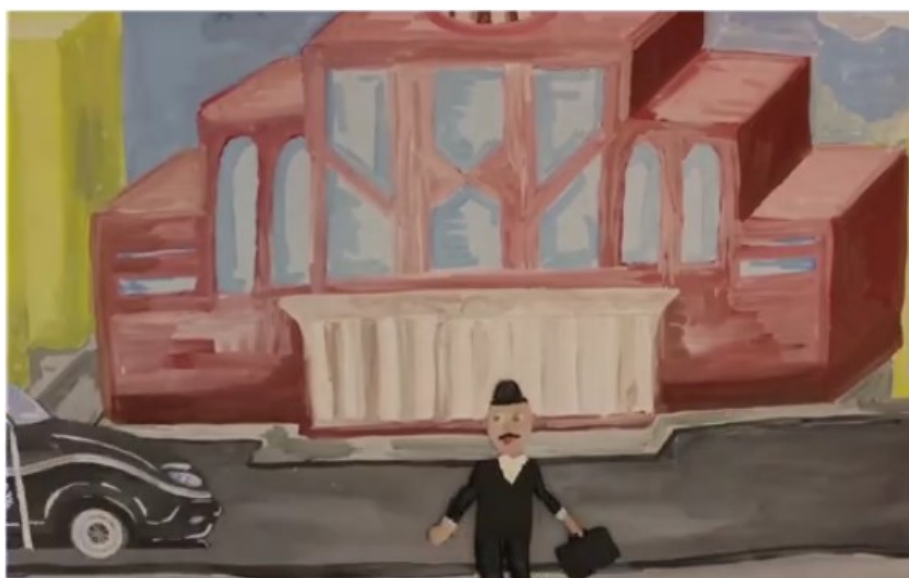
Фрагмент мультфильма «Человек исключительной храбрости», создан на проектной школе ОЦ «Сириус»

Разберем кейс реального проекта. Моя коллега делала проект, в котором дети создавали мультипликационный ролик. Участники выбрали темой преодоление страха. Проект сделали, защитили, и уже после этого моя коллега сказала: «Я же волонтер в организации, которая помогает детям с ДЦП! Почему я заранее не подумала о том, чтобы мы сделали ролик для этой организации?» Я привела этот пример для того, чтобы показать: на старте люди часто забывают подумать о том, что проект можно сделать для кого-то, для конкретного заказчика.