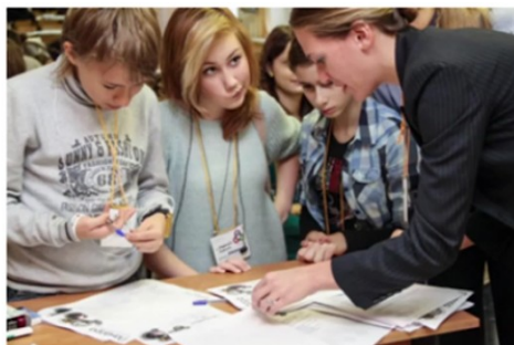
Пространство свободы и самостоятельного действия