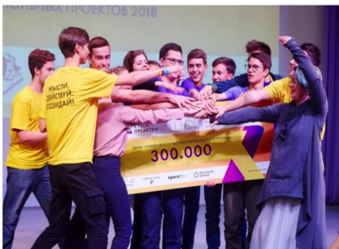
Команда проекта «Шопука»

планирует открыть свою фирму, чтобы реализовывать собственные проекты