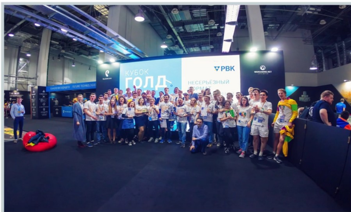
Кубок Голдберга 2017 на XIX Всемирном фестивале молодежи и студентов. Сочи, октябрь 2017 г.

Помните о том, что не стоит подменять мотивацию к созданию проекта мотивацией победить в конкурсе!