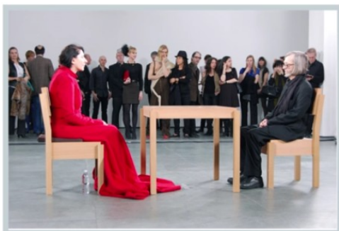
Marina Abramovic, “The Artist is Present”, 2010