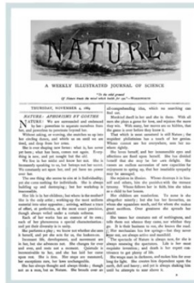
Обложка журнала Nature, 1869г.

Научная статья — средство коммуникации, которым пользуются ученые.